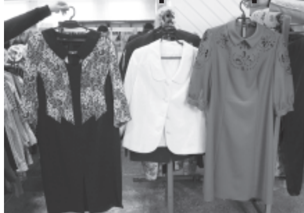
Вот такие вещи можно купить в универмаге.

что-то качественное, будь добр раскошелиться.